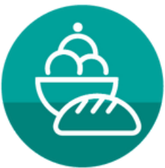
Panes y Postres

Es entendida como una preparación culinaria con un proceso más simple o rápido de preparar, con menos ingredientes en su elaboración. Puede ser una guarnición que se acostumbre para acompañar al plato principal: arroces arreglados, purés, ensaladas, tortillas palmeadas, etc. También funciona como una entrada que se consume de previo al plato principal como: sopas, cremas, etc. También se incluyen los alimentos que se consideran meriendas que se consumen en los tiempos del café: picadillos, tortillas aliñadas, etc.