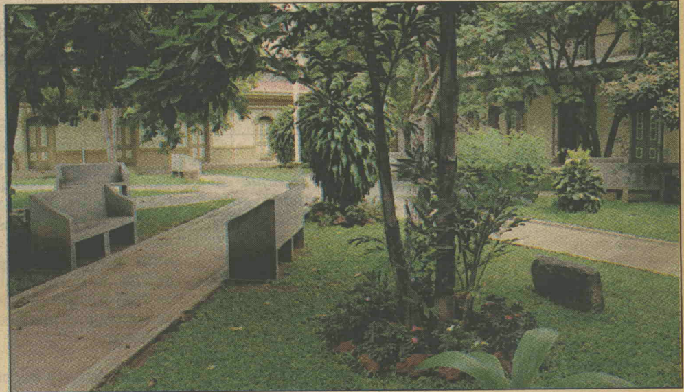
La Casa del Artista abrirá su primera sede regional en las instalaciones del Centro Alajuelense de la Cultura.