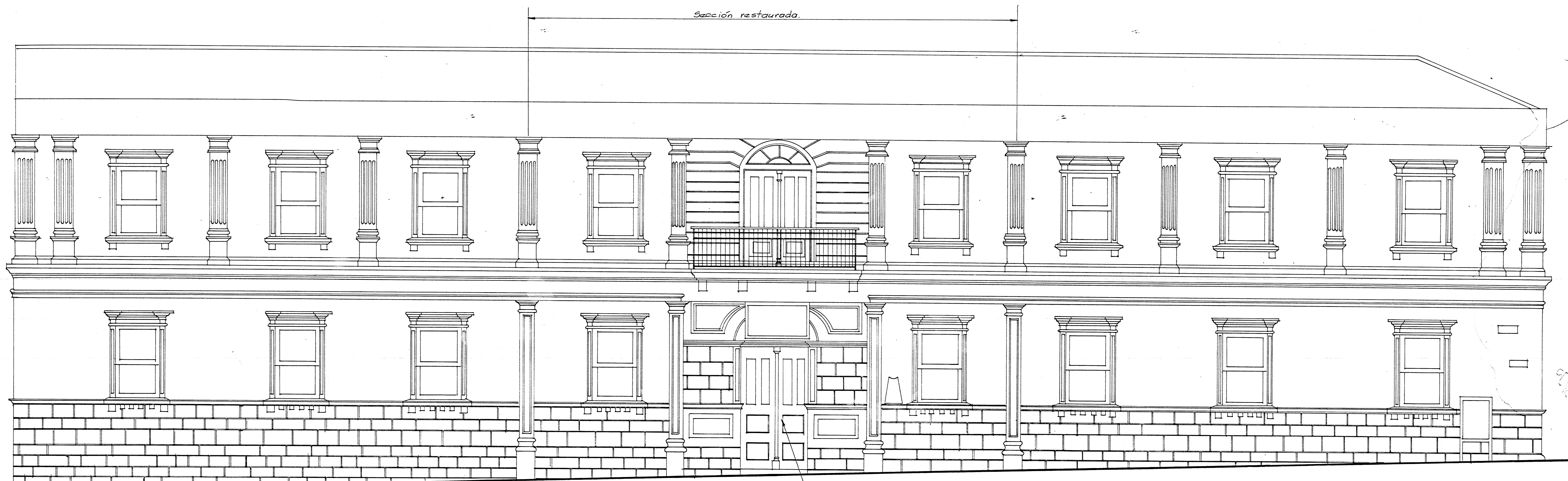
FACHADA ESTE ESC. 1:50

Nota 1. Colores originales. Nota 2. Puerta a restaurar en las mismas calidades y características de la existente en el balcón de la fachada este. Nota 3. Batar muro que bloques acceso al balcón. Nota 4. Puerta a rehacer, eliminar la de hierro. Deberá construirse con la misma calidad y forma a la ubicada en la fachada este.