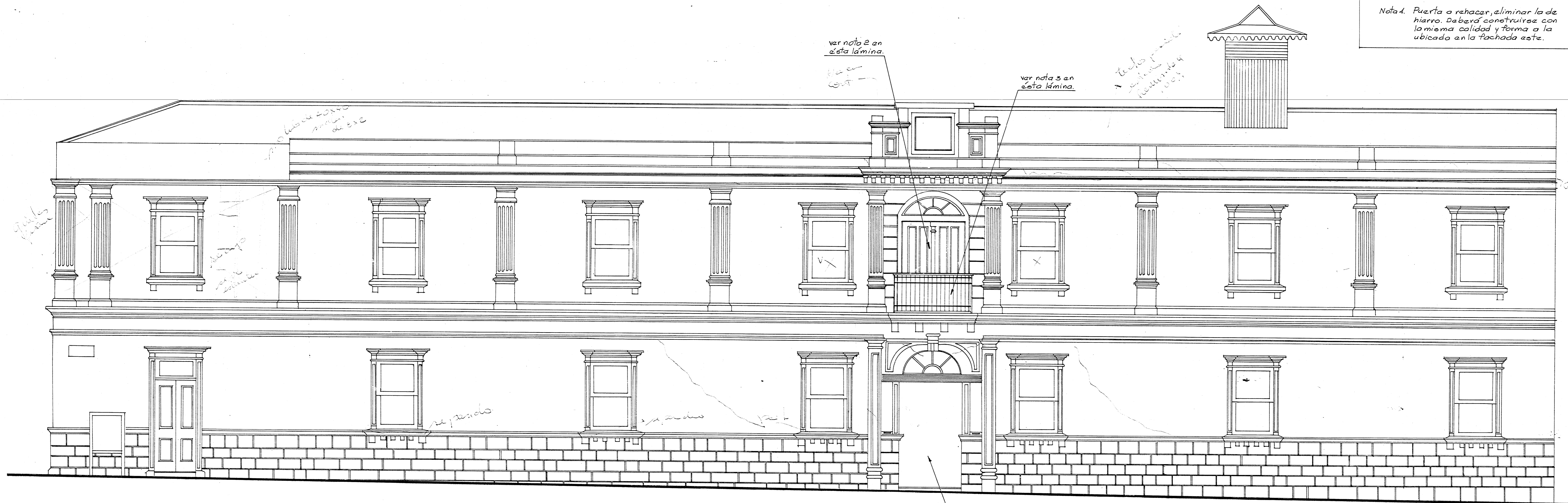
FACHADA NORTE ESC. 1:50

Nota 1. Colores originales. Nota 2. Puerta a restaurar en las mismas calidades y características de la existente en el balcón de la fachada este. Nota 3. Batar muro que bloques acceso al balcón. Nota 4. Puerta a rehacer, eliminar la de hierro. Deberá construirse con la misma calidad y forma a la ubicada en la fachada este.