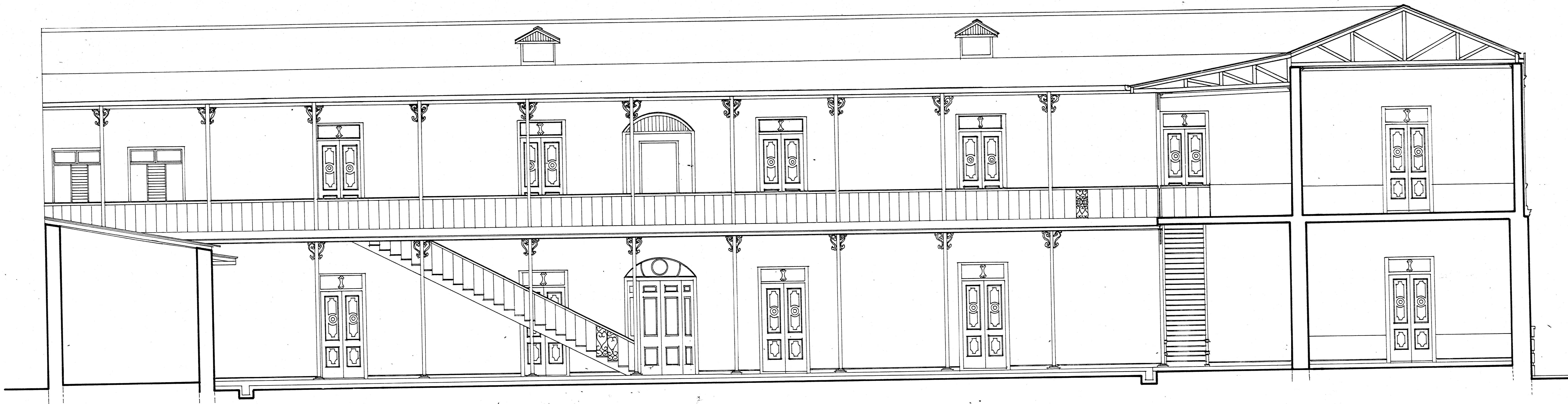
SECCION AA ESC. 1:50