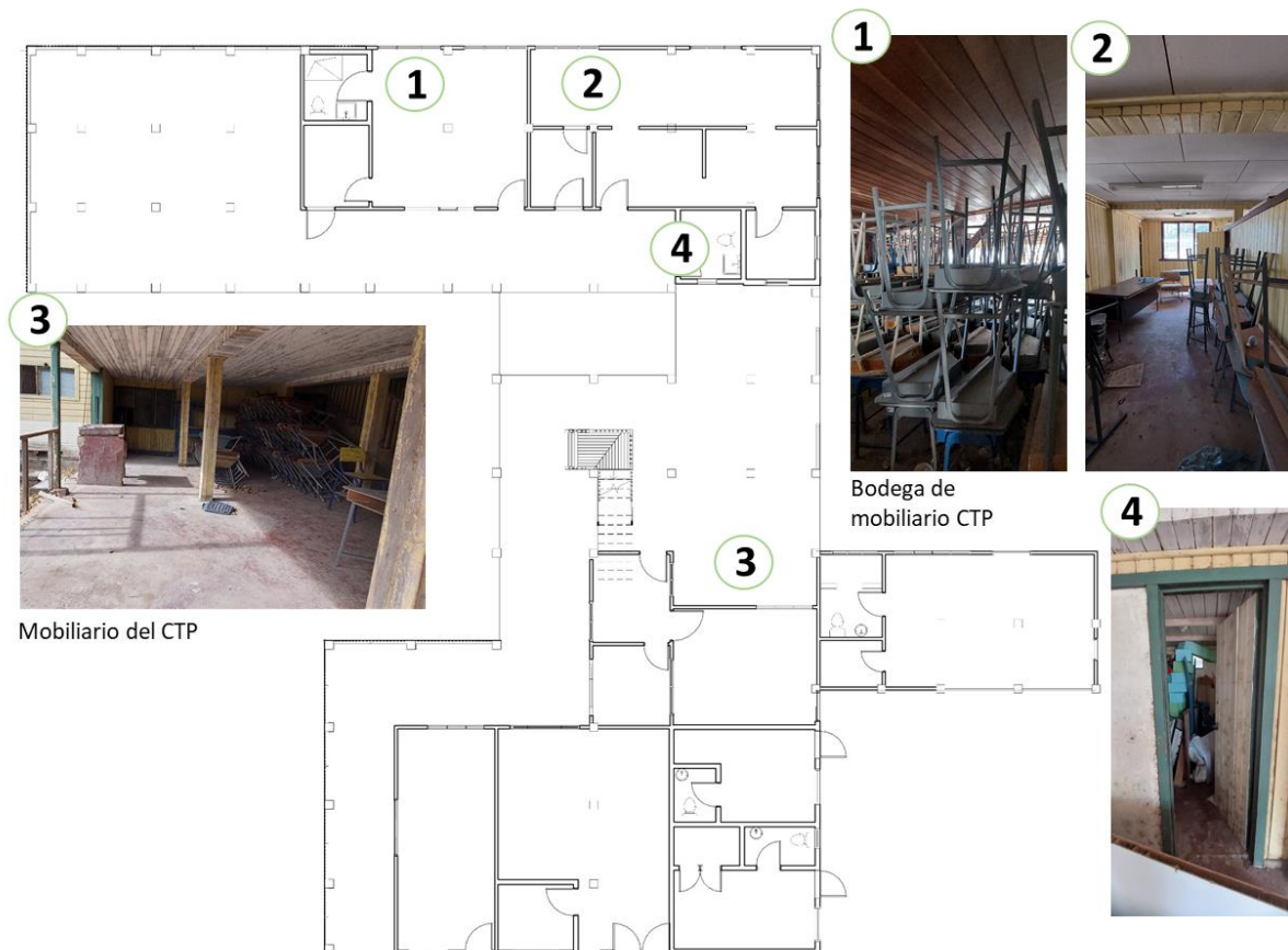
Planta arquitectónica primer nivel

Las oficinas de la planta baja, funciona como bodega del Colegio Técnico Profesional, guardan mesas, sillas, pantallas para proyectar, cajas con documentos, tubos de agua, trabajos de estudiantes, entre otras cosas, una de las oficinas alberga materiales del INDER.